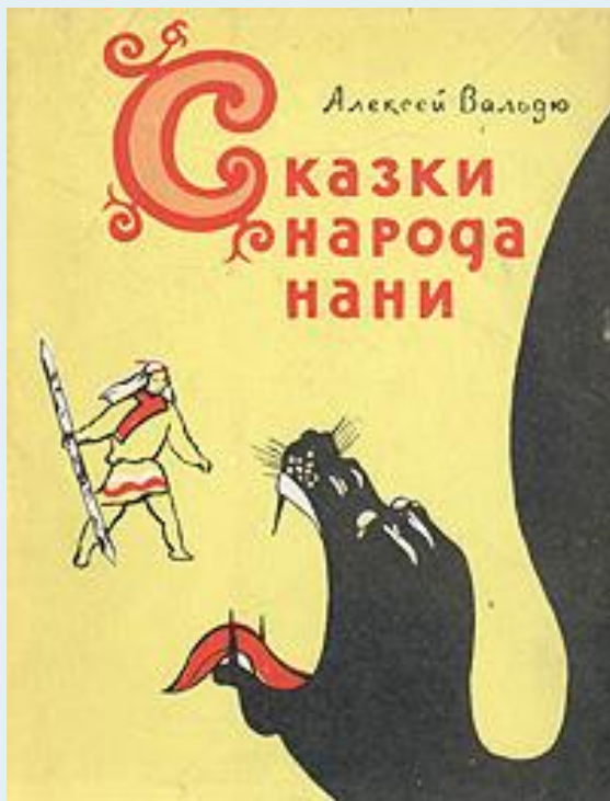
Вальдю А.Л. "Как нани счастье нашли"